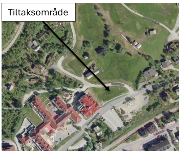
Figur 2: Flyfoto av planområdet. Hentet fra kommunens egen karttjeneste.

Planen er ikke omfattet av forskrift for konsekvensutredning.