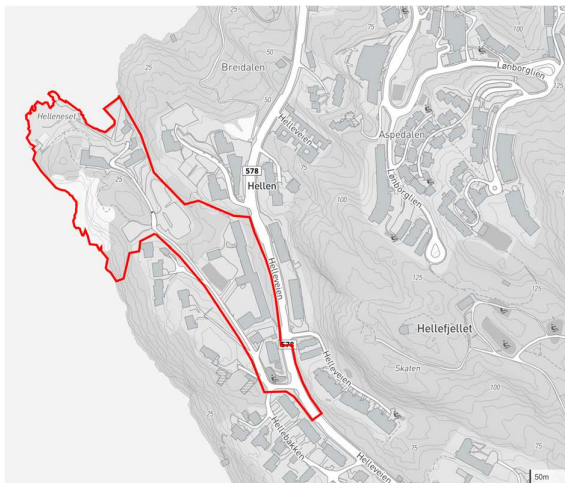
Figur 1: Oversiktskart med lokaliseringen av planområdet.

Foreslått planavgrensning omfatter gbnr. 168/1771 med tilhørende vegarealer. Det er tatt med påkrevde siktsoner mot fylkesveg Helleveien, og sidearealer for kommunal veg Hellebakken for nødvendig vegutbedring. Planområdet omfatter også eksisterende underavdeling av Solbakken barnehage og friluftsområde for å vurdere muligheter for tilføring av kvaliteter for av arealene. Det er ikke planlagt tiltak som endrer formål eller arealbruk av områder innenfor funksjonell strandsone i KPA 2018, men områdene er tatt med for vurdering av uteoppholdsarealer som skal offentlig tilgjengelige.