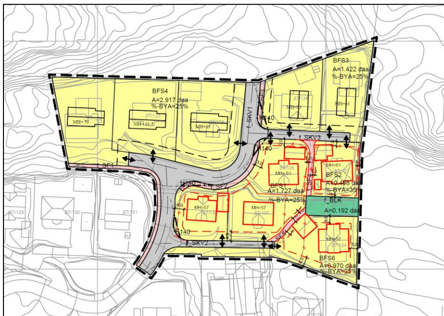
Figur 2 - Endringer i plankartet