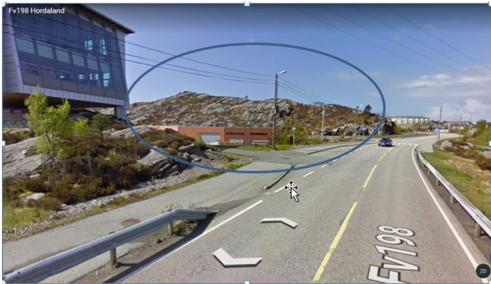
Figur 3: Bilete henta frå Google Earth som viser «område A»

Område merka som B i kartutsnittet er delvis regulert og planlagde reguleringsføre mål vil være i tråd både med reguleringsplan og kommunedelplan for Skogsskiftet. Arealet som ligg utafor svart stipla line, men innafor raud stipla line er ikkje regulert, men ligg i kommunedelplan for Skogsskiftet som framtidig friområde/idrettsanlegg. I planen sine førese gner går det fram at « Området skal nyttast til idrettsføre mål ». Delar av området er også merka som eksponert område.