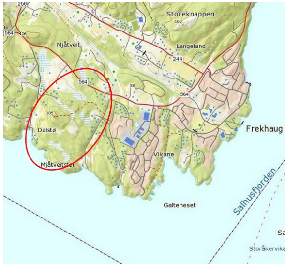
Oversiktskart, raud ring syner planområdet