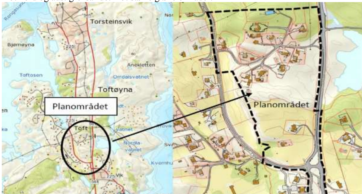
Figur 1 – Kart over planområdet.

Planområdet ligg på Toft om lag 1,5 km sør for Torsteinsvik i eit område med spreidde bustader og grøne områder. Mot søraust til vest grensar området mot bustadområde, medan mot nord og aust grensar det mot større grøne områder.