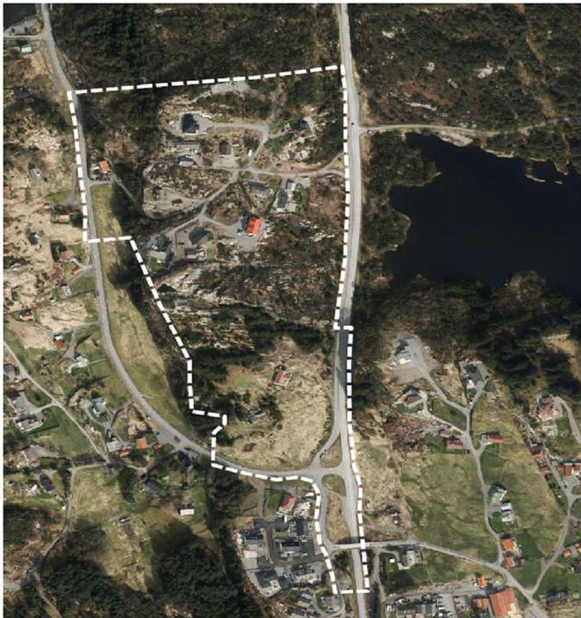
Figur 2 – Flyfoto over planområdet.

Planområdet ligg i eit småkupert terreng avgrensa av Toftøyvegen i aust og fv. 225 i vest. Det er to høgdedrag i planområdet, eit om lag midt i planområdet, og Dalekletten som avgrensar området i nord. I vest går det ein vestvendt brattskrent mellom planområdet og fv. 225. Det er i dag spreidd busetnad i planområdet og dette er hovudsakleg einebustader, men det er også ein fleirmannsbustad. Det fleste av einebustadane ligg i eit relativt flatt terreng mellom dei to høgdedraga. I sør er det eit område med tidlegare dyrka mark. Det er i alt 12 einebustadar og ein fleirmannsbustad i planområdet. På Dalekletten ligg vassforsyningsanlegg for Toft.