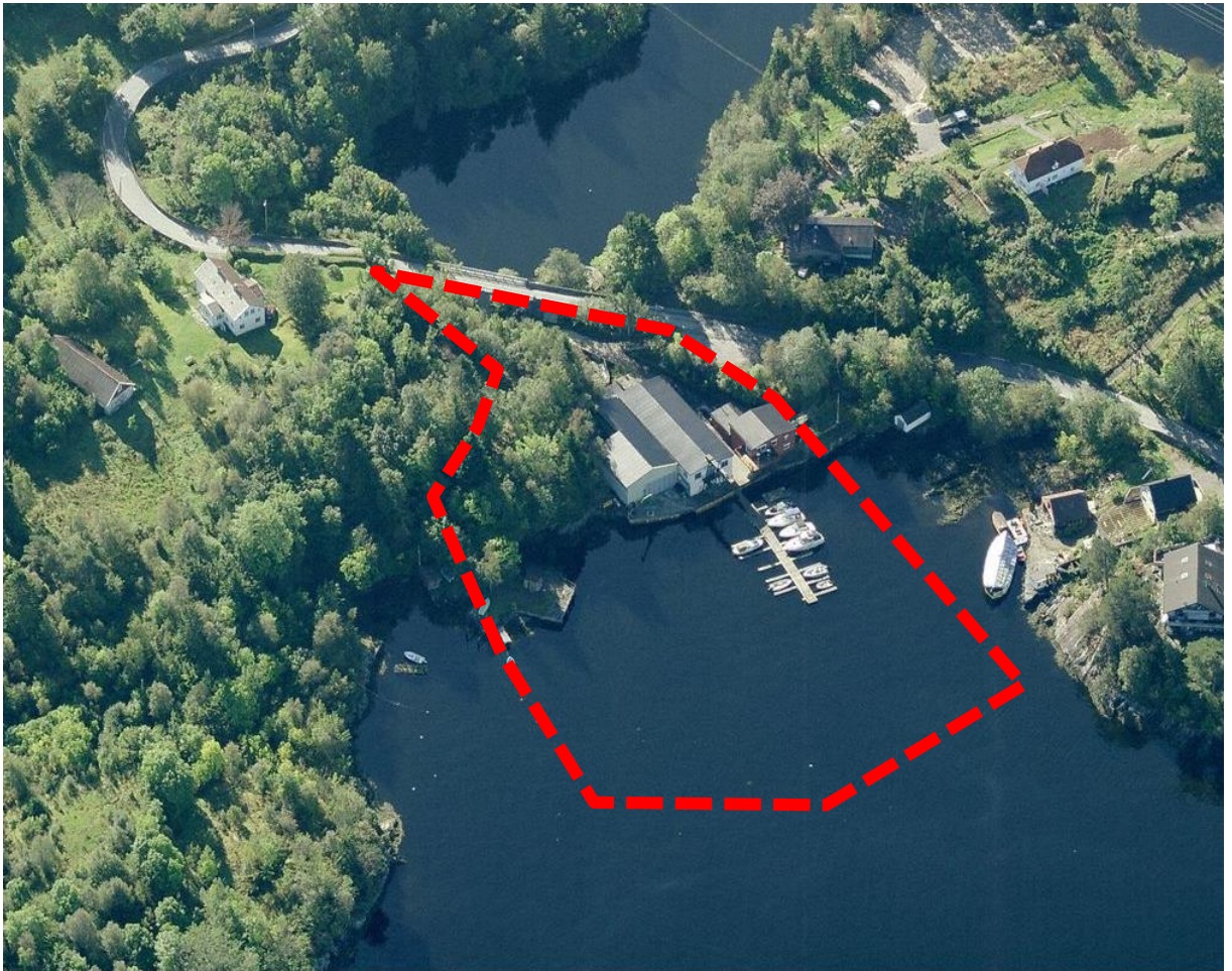
Figur 2 Omtrentlig planavgrensning på skråfoto

fra Hopsvannet gjennom området som forsyner et smoltanlegg lenger nord med ferskvann.